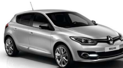
Megane II y III