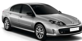
Laguna II y III