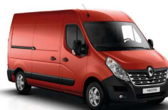
Master II y III