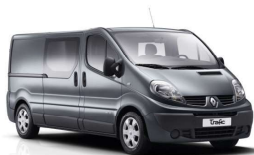
Trafic II y III