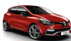
Clio II, III y IV