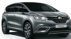
Espace III, IV y V