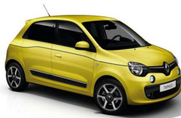
Twingo II y III