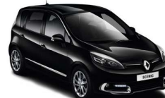
Scenic II y III